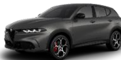
851 - Grigio Vesuvio