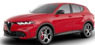
414 - Rosso Alfa