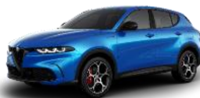
756 - Blu Misano