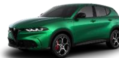
398 - Verde Montreal