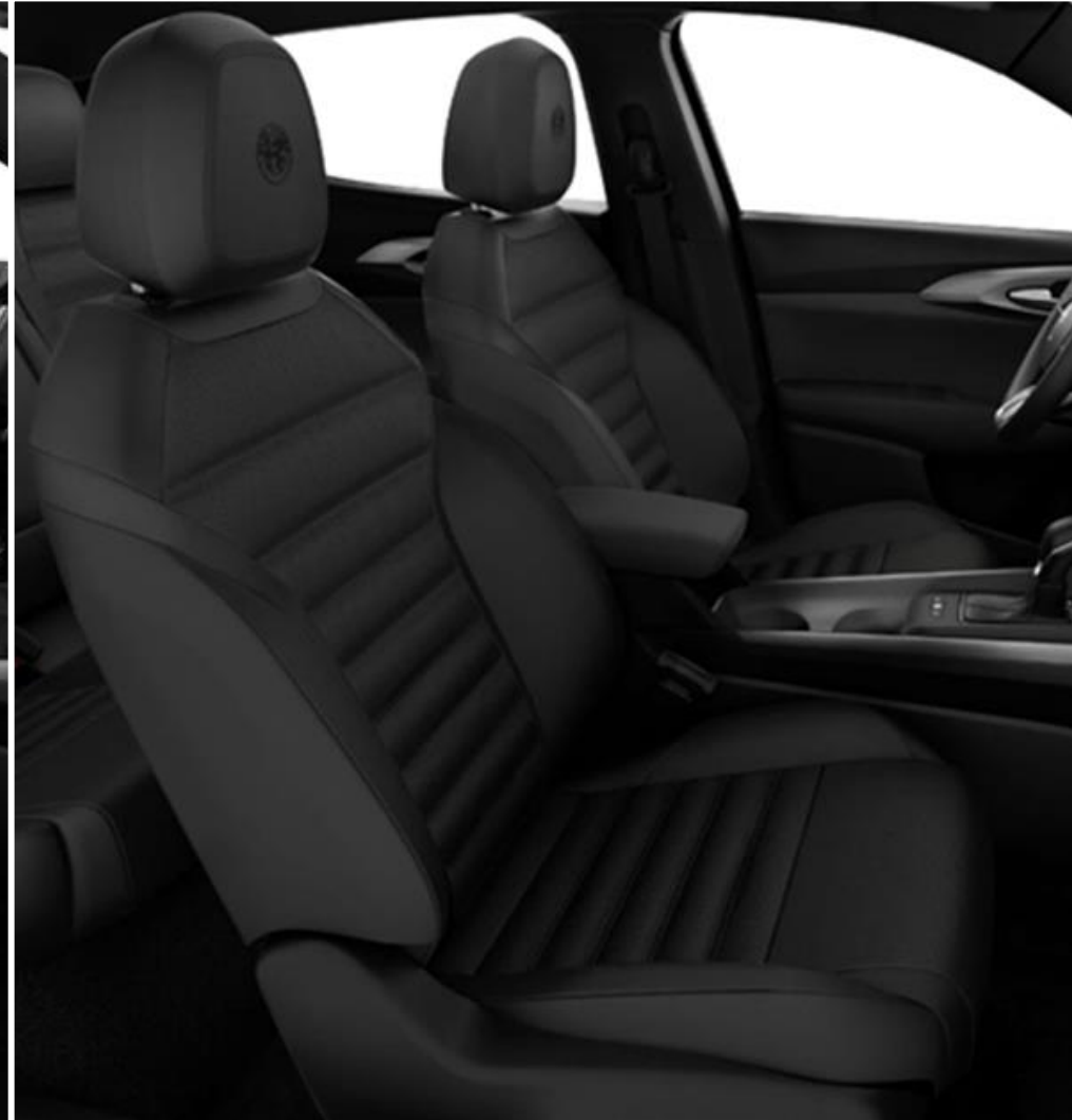
PACK LEATHER & PACK PREMIUM Pelle nera traforata (cod. 428)